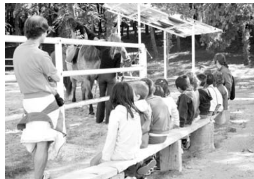
Actividade de granxa-escola para nenos e nenas