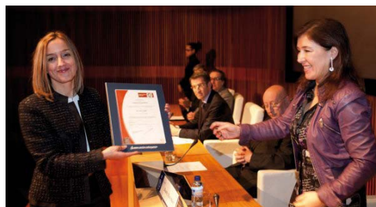
Acto Entrega Certificacións ISO-9001 na Coruña

Desde a consecución deste certificado estivemos traballando na evolución e perfeccionamento do noso Sistema de Xestión da Calidade, para garantir que a atención prestada a nenos, nenas y familias é rigorosa e eficaz.