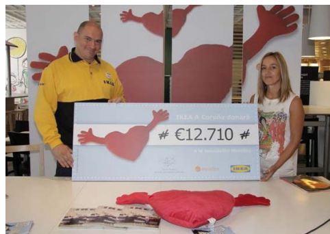
Entrega da doazón de IKEA a Fundación Meniños

Así mesmo, financiaranse os proxectos de innovación e estudos, que nos permiten avaliar a nosa intervención e mellorar os servizos que dan resposta ás distintas problemáticas familiares.