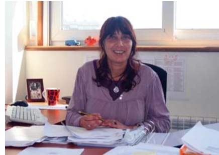
Kucha Movilla Fidalgo

Para desevelo puxemos en marcha novos equipos de intervención que realizarán unha tarefa de apoio específico para os Servizos Sociais Municipais nas súas intervencións.