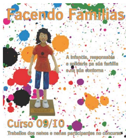
Portada Boletín “Facendo Familias Curso 09/10”

Queremos destacar do traballo dos últimos meses a publicación coa que rematamos o concurso levado a cabo no pasado ano co gallo da proposta Facendo Familias: un boletín que recolle os debuxos, murais, relatos... dos nenos e nenas, e que nos dan unha mostra moi clara e fermosa da súa visión sobre a familia. Tédela á vosa disposición nas nosas páxinas web.