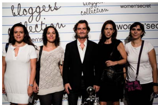
Presentación de Blogger’s Collection

A presentación oficial das coleccións tivo lugar o pasado 14 de setembro en Madrid.